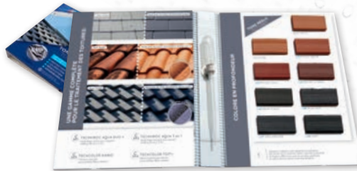
Nuancier «Tons réels toiture»